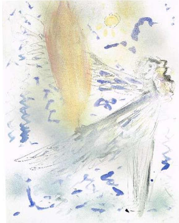
Wächterengel vor dem Tor ins Paradies Wir sind Kinder des Universums